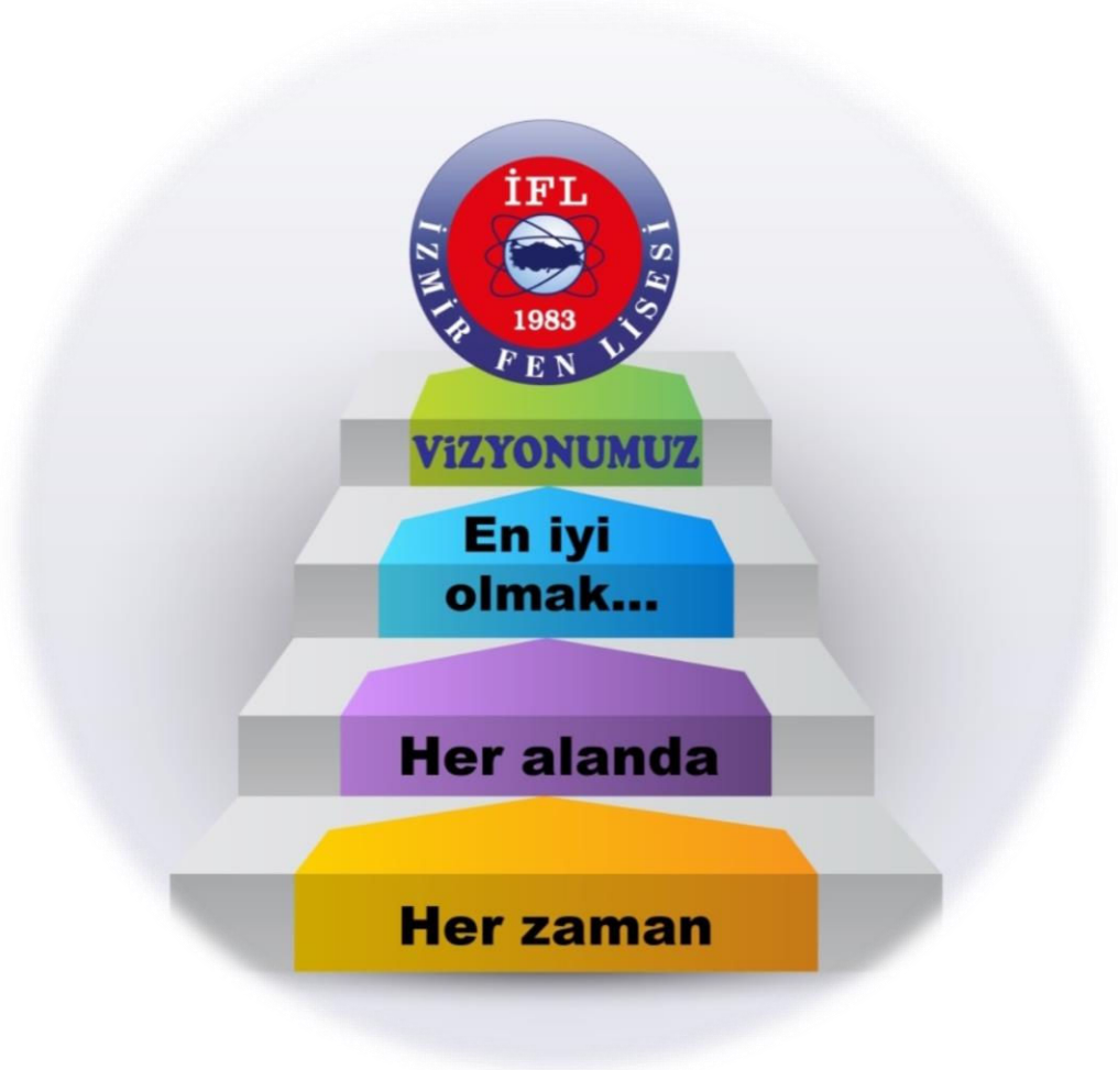
Şekil 3- Vizyonumuz