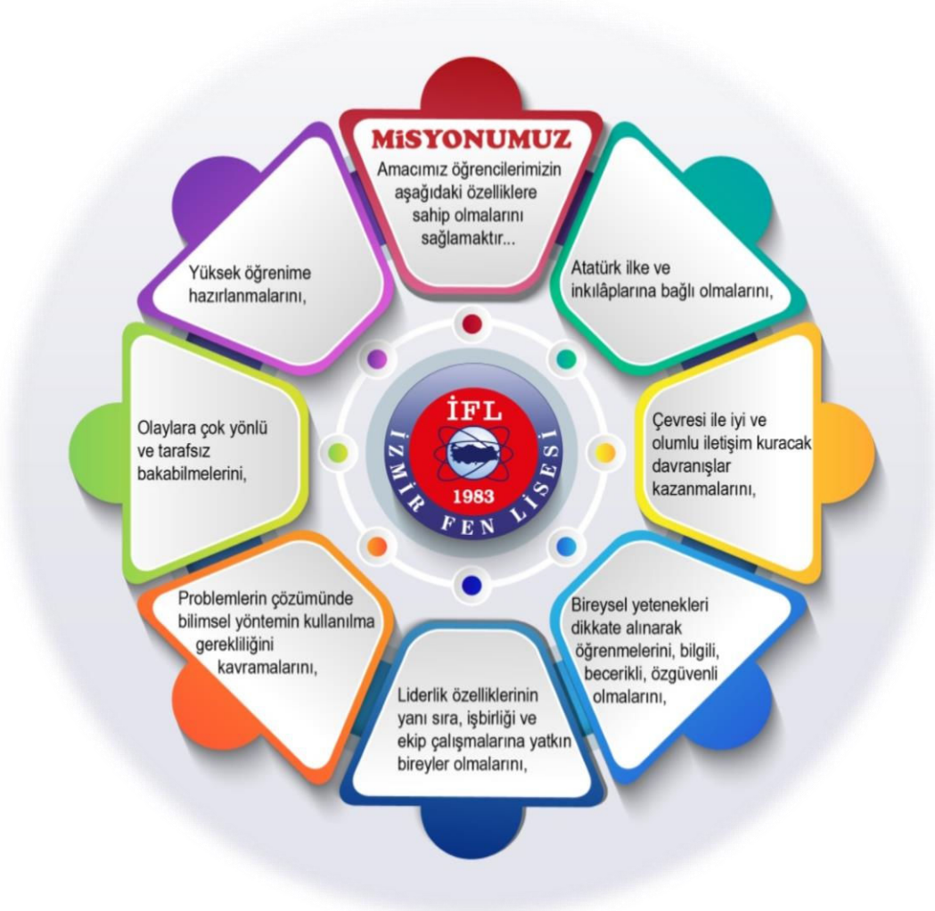
Şekil 2- Misyonumuz

Biz Türkiye ve dünya için bilim, teknoloji ve fen alanında çağımızın gerektirdiği şekilde sorgulayan, yaratıcı düşünen, araştıran ve üreten bireyler yetiştiren İZMİR FEN LİSESİYİZ.